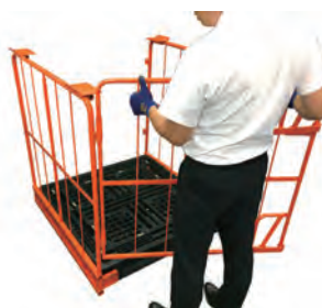
片扉ツブシ部分を差込み扉を下げ、回転させます。