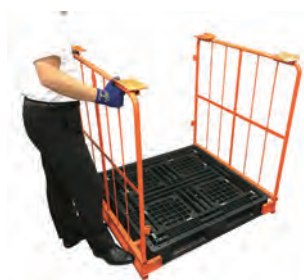
サポート取付。金具をパレットのフォーク差込口に押し込みます。