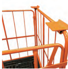
段積用スタッキングプレート (オプション品)