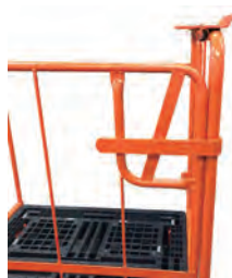
片扉の締金具を上下させ、開閉します。