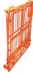
未使用時 (自立はしません)