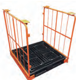
サポート取付完了。